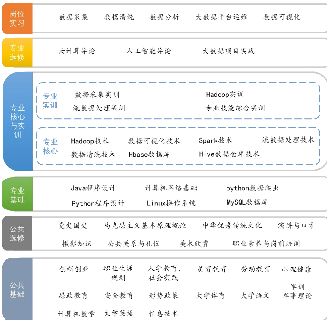
图 2 课程结构图